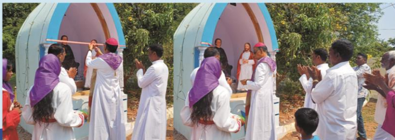
Blessing of Stations of the Cross, Sesurajapuram