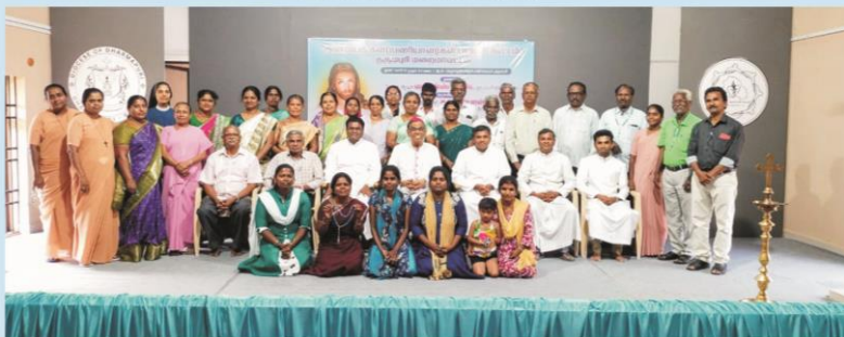
Training for Anbiam Leaders