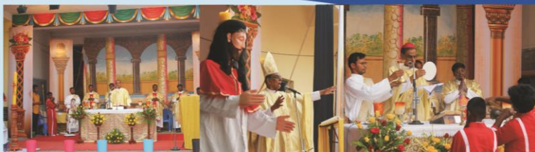
Pascha Celebration and Mass at Kovilur