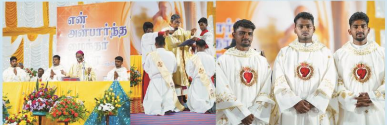
Diocesan Diaconate and Priestly Ordination. Congratulations Dear Fathers and Deacon