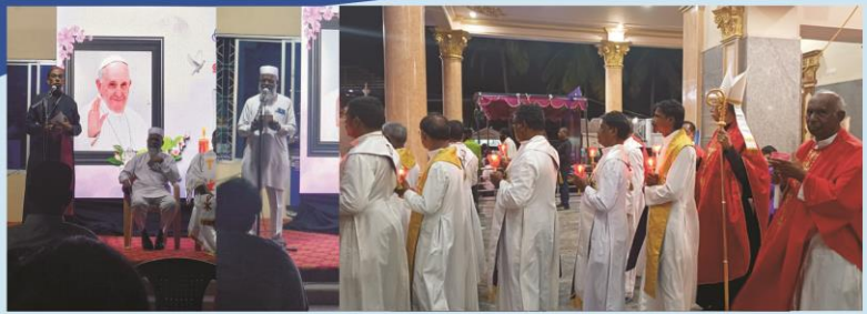
Requiem Mass for Pope Francis at Krishnagiri