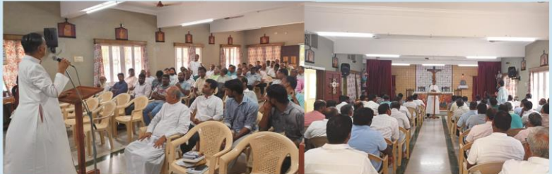
Priestly Sanctification day Recollection at Bishop's House