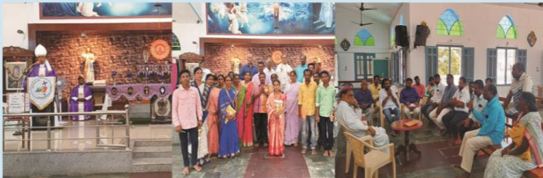
Pastoral Visit at Bommi