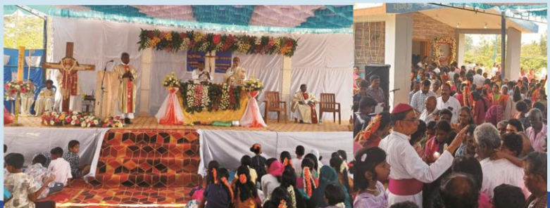
Feast of St.Antony at Dasarapalli